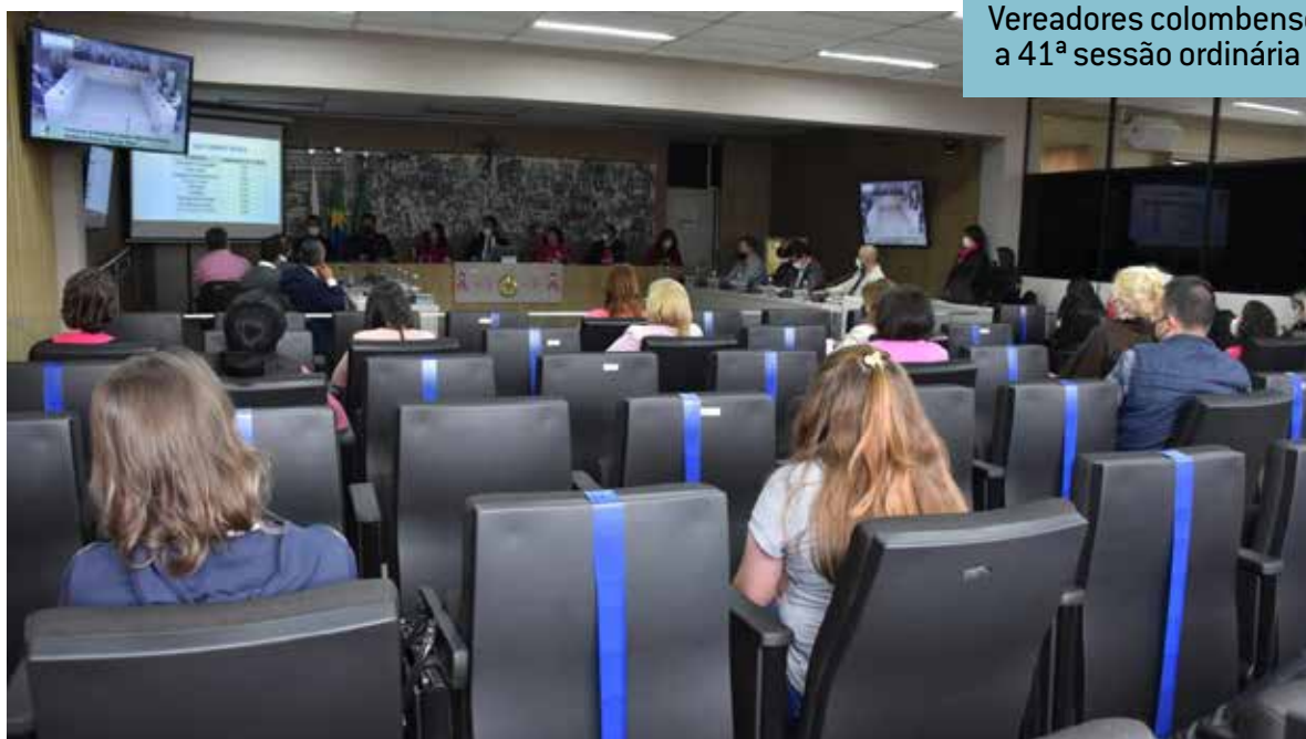
Vereadores colombenses realizam a 41ª sessão ordinária de 2021.

Três matérias foram aprovadas pelo Plenário para serem incluídas na pauta original da Ordem do Dia. Também foram divulgadas as Emendas Aditiva, Modificativa e Supressiva ao Projeto de Lei do Executivo nº 60/2021, de iniciativa das Comissões de Constituição e Justiça; Economia, Finanças e Orçamento e Defesa do Cidadão e Segurança Pública. O projeto dispõe sobre a criação da Corregedoria e da Ouvidoria da Guarda Municipal de Colombo.