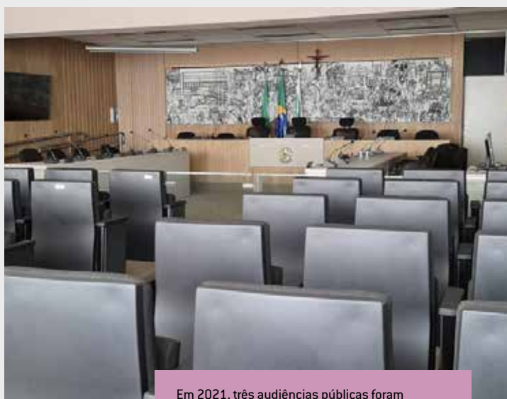
Em 2021, três audiências públicas foram promovidas no Plenário da Câmara Municipal de Colombo.

Ainda conforme o balanço anual, o Plenário aprovou nove moções (sendo seis de apoio e três de repúdio), 267 votos de congratulações e 180 votos de pesar apresentados pelos 17 vereadores que compõem a atual legislatura da Casa de Leis. Mais informações sobre a produção legislativa da Câmara estão disponíveis no site da Câmara Municipal de Colombo.