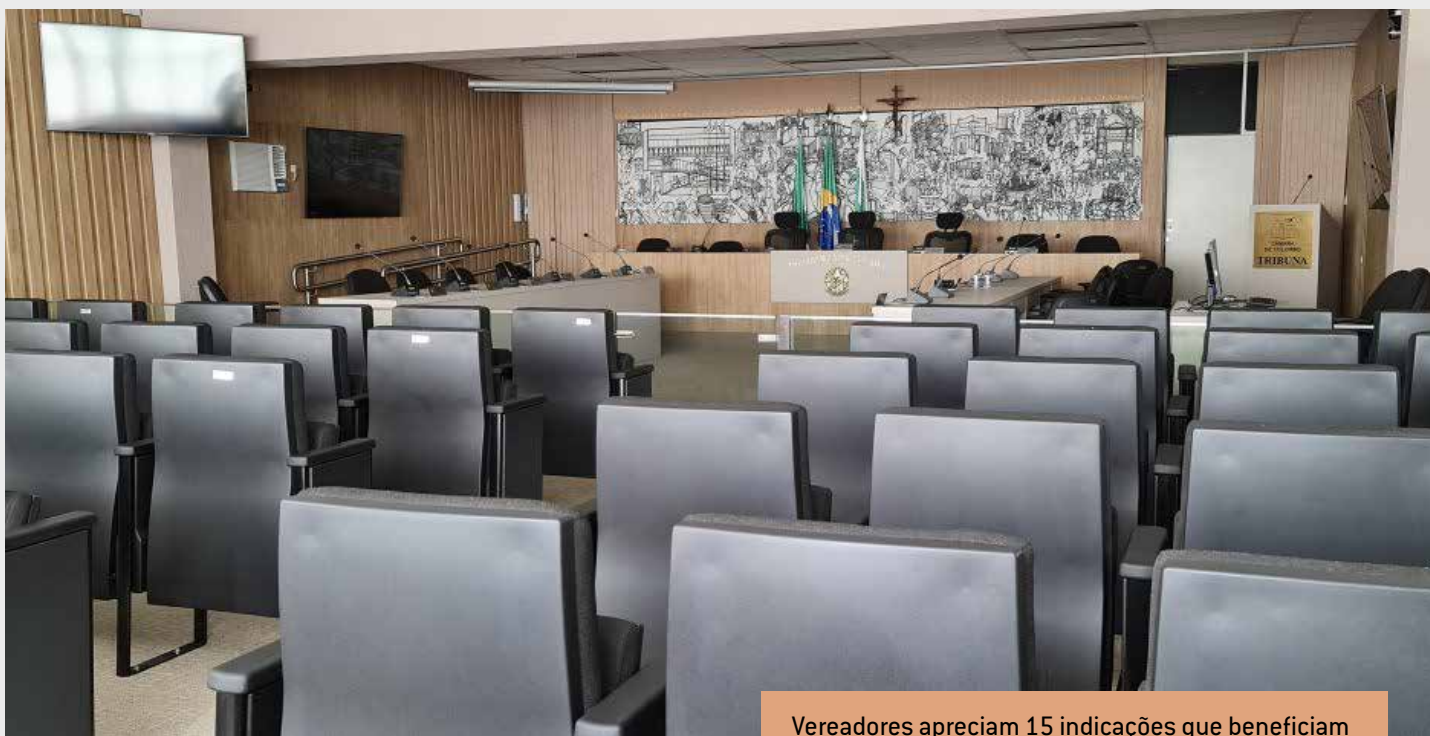
Vereadores apreciam 15 indicações que beneficiam os moradores de Colombo.