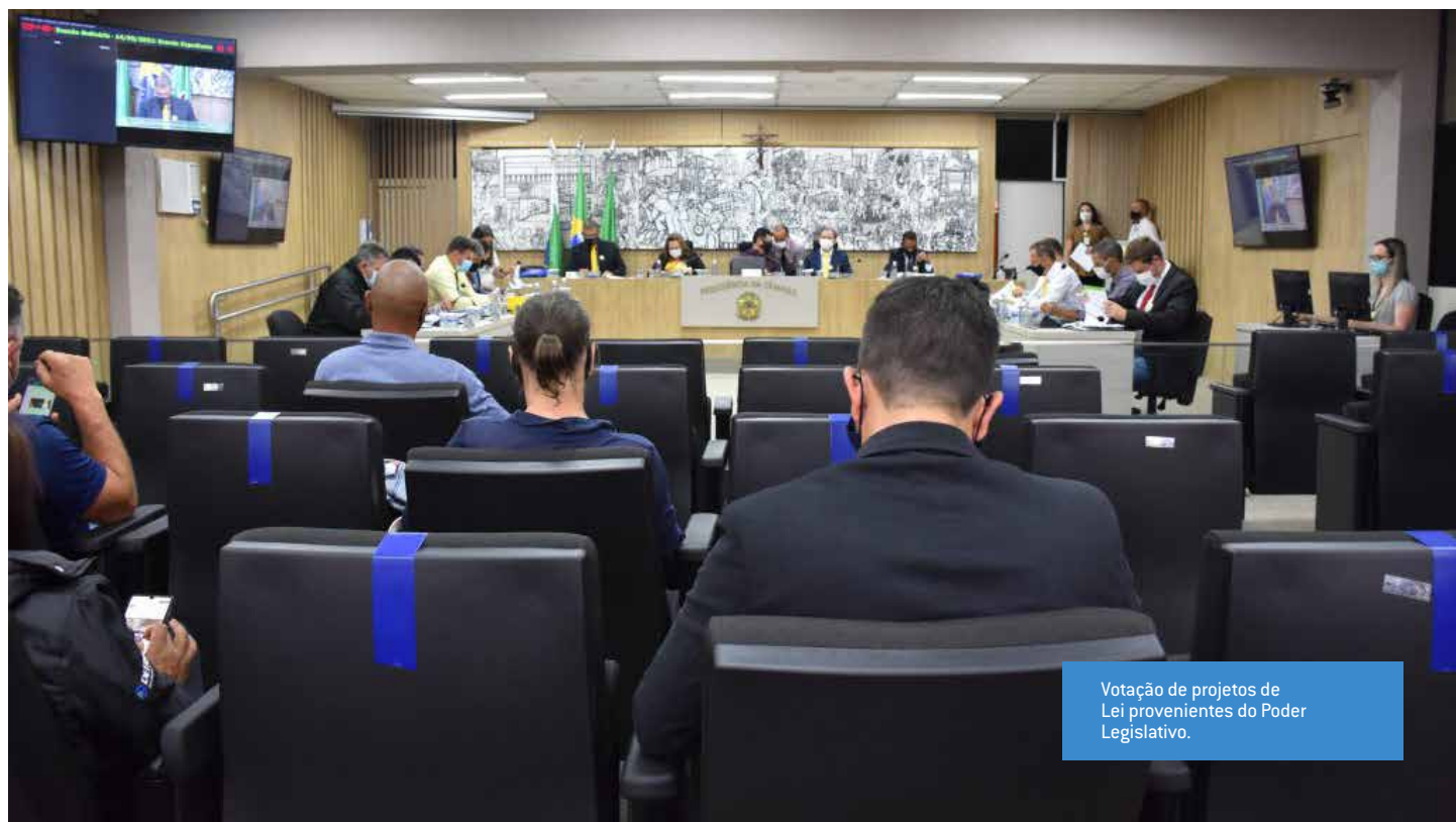
Votação de projetos de Lei provenientes do Poder Legislativo.

Um tema comum apresentado pelos parlamentares nas sessões plenárias são os comentários em relação à qualidade do serviço de recomposição do asfalto, após os trabalhos realizados pela própria estatal ou pelas empresas terceirizadas no município de Colombo.