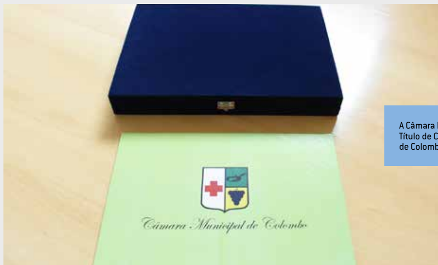
A Câmara Municipal de Colombo entrega Título de Cidadão Honorário do município de Colombo.

Em período de pauta estão dois projetos de lei do Executivo Municipal. O PL 18/2022 dispõe sobre alterações nos Anexos I e II para os exercícios de 2023, 2024 e 2025 do Plano Plurianual do período 2022 a 2025, expresso em normas, objetivos e principais metas a serem observadas pelas Unidades da Administração Direta, Fundos do Poder Executivo, Autarquia Colombo Previdência e pelo Poder Legislativo do município de Colombo e o PL 19/2022 dispõe sobre as Diretrizes Orçamentárias para o exercício de 2023.