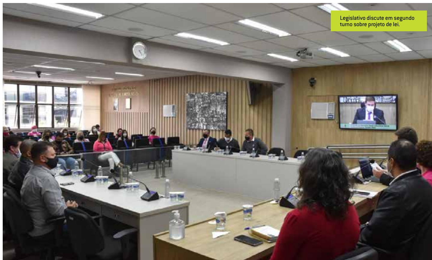
Legislativo discute em segundo turno sobre projeto de lei.

O segundo também desafeta bem público municipal, correspondente a parte da Rua Rio Grande do Sul, autoriza seu remembramento/desmembramento para fins de regularização fundiária e determina outras providências. Ambas as proposições seguem para a sanção da Prefeitura Municipal.