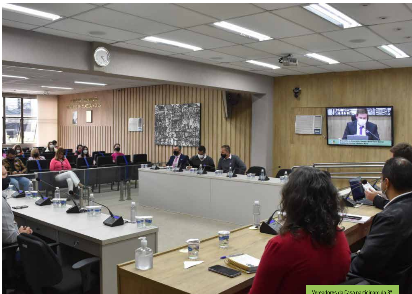
Vereadores da Casa participam da 3ª sessão extraordinária de 2022.

ano, créditos adicionais especiais e suplementares. Outros dois projetos também foram votados em segunda votação. O PL do Executivo 58/2021 institui o Programa de Parcerias Público-Privadas (PPP) no município. Já o PL do Executivo 1/2022 revoga a Lei Municipal nº 1.098/2009, que autoriza o Poder Executivo a ceder o uso de bem público ao Estado do Paraná para a implantação do Programa Federal Mercado Brasil. Todas essas proposições seguem para a sanção do prefeito Helder Luiz Lazarotto (PSD).